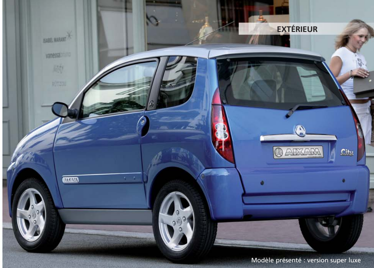
Modèle présenté : version super luxe

Nouveaux phares plus félins, optiques arrières redessinées, jantes de 14 pouces au design spécifique, silhouette... avec ses lignes épurées, City s'impose comme une référence esthétique des véhicules sans permis.