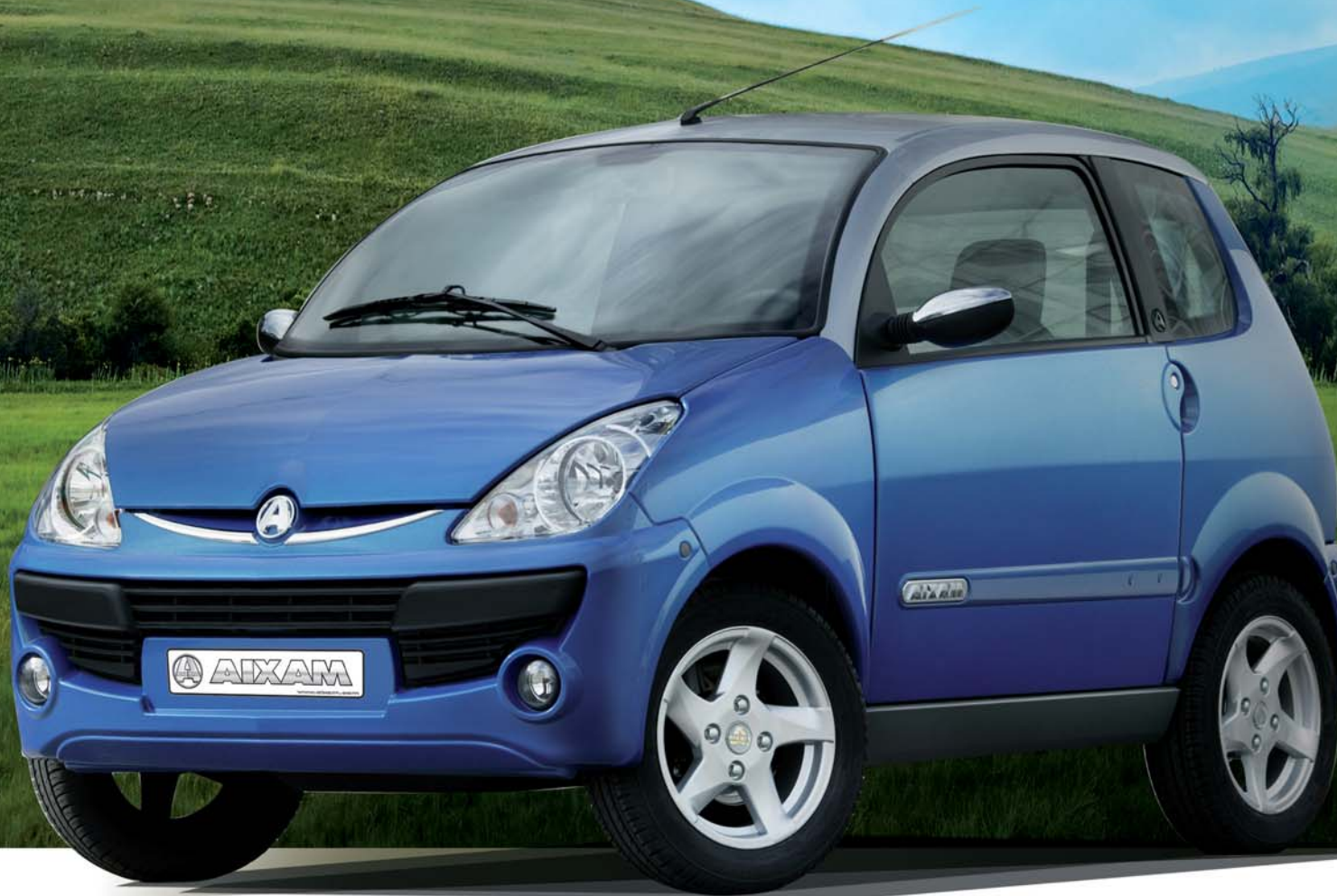
Modèle présenté : version super luxe

Pour AIXAM, l'environnement est un enjeu majeur depuis toujours. Cette priorité se traduit par une recherche d'optimisation constante sur les motorisations, l'aérodynamisme et le recyclage de ses véhicules. Ainsi, en association avec KUBOTA pour les moteurs diesel, et LOMBARDINI pour les moteurs essence, AIXAM a développé toute une gamme de motorisations, se caractérisant par une très faible consommation, et une émission de CO2 la plus maîtrisée de sa catégorie.